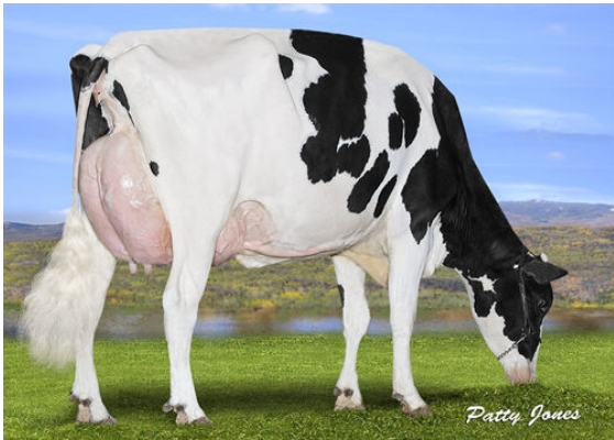
PROGENESIS DENVER BETSY GRANDDAM